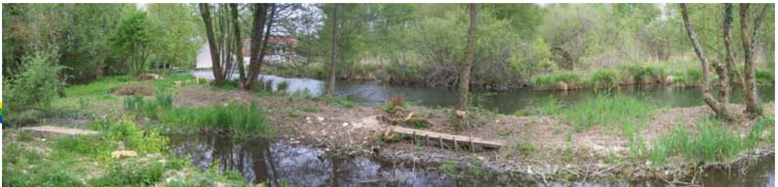
Vue panoramique du site