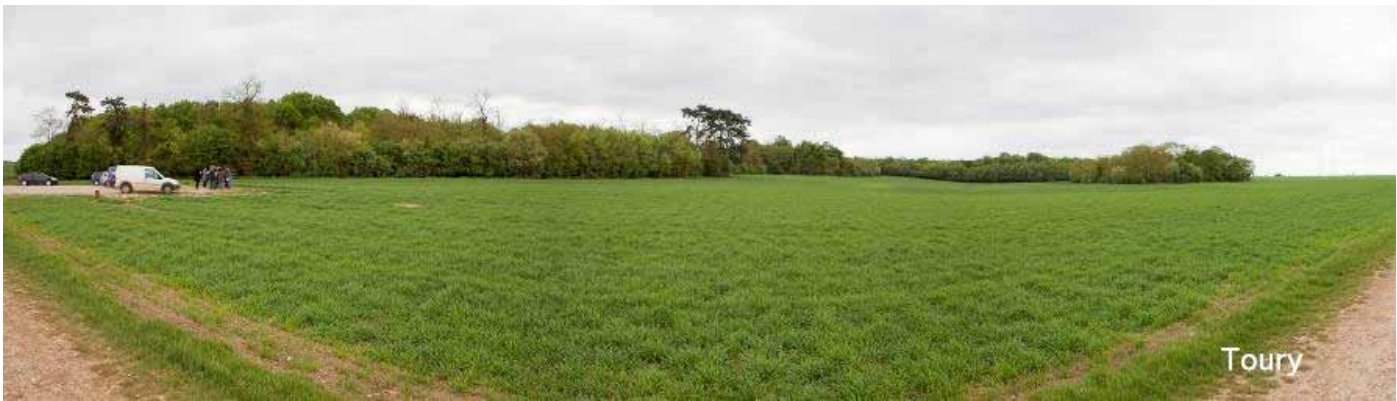
Vue panoramique du site