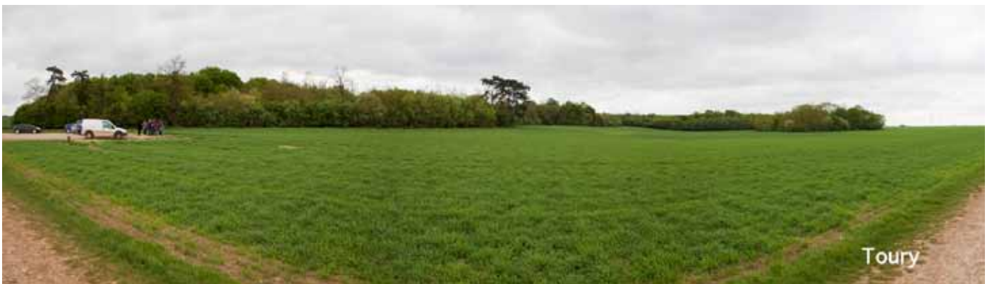
Vue panoramique du site