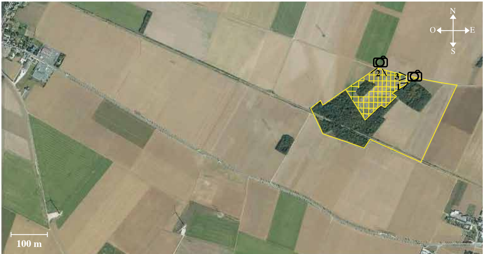
Vue aérienne du site